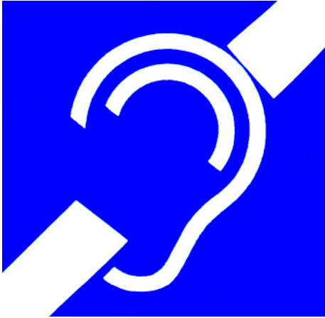
Abbildung 2: Piktogramm Schwerhörige / Gehörlose